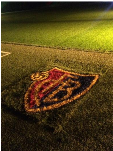
Heiliger Rasen des Stadions

Anlässlich der Fussballeuropameisterschaft 2008 wurde die Kapazität nochmals erhöht und eine steile Nordtribüne erbaut.